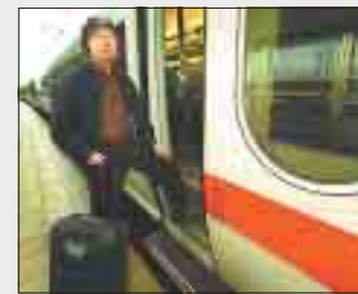
Nürnberg's Ex-OB Peter Schönlein

Peter Schönlein Meine lange Bahn-Reise durch Deutschland Seite 7